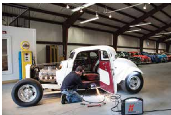
Réparation et modification de véhicules