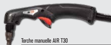
Torche manuelle AIR T30