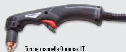
Torche manuelle Duramax LT